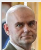
brig. gen. Miroslav FEIX

Velitel, Velitelství kybernetických sil a informační podpory, Armáda České republiky