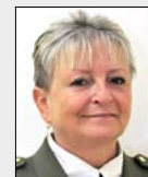
brig. gen. prof. RNDr.